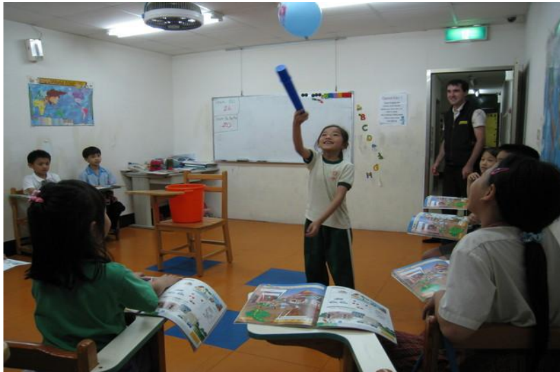
圖 2.小朋友上課中利用遊戲開心的學習

我們很榮幸有機會能參加夏恩英語補習班的校外實習工作，讓我們了解補習班的教學過程，例如：學習上課的技巧以及面臨到各種突發狀況時我們該如何解決。在剛開始上課時外籍教師會先複習前一次的上課內容，接著再開始新的課程。他們以遊戲及道具來吸引小朋友的注意力，讓他們加深印象且能更快速的背英文單字。