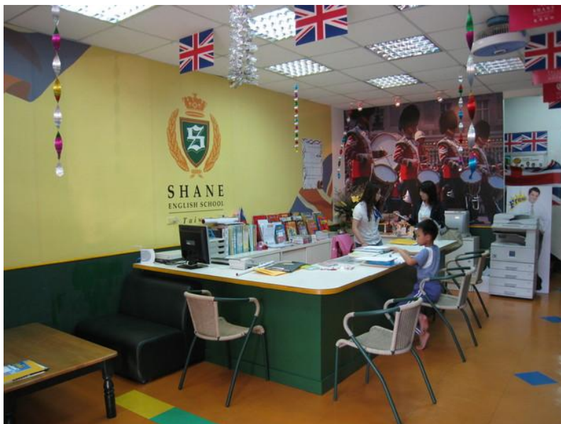
圖 1.乾淨的環境、活潑的佈置讓小朋友更容易學習