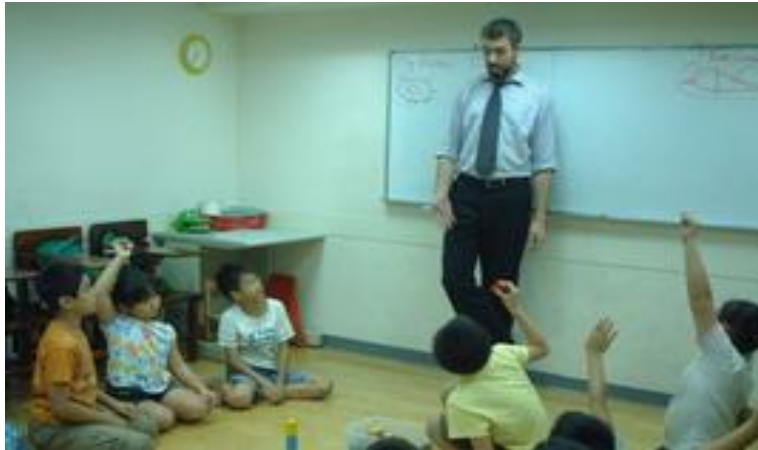
圖 4.外籍教師上課方式活潑、有趣，小朋友快樂的學習英語

幼兒班小朋友學英文的年資不若兒童班學習英文的年資，而且可能會因為一些因素而中斷學習，所以小朋友的學習年資平均都在半年到一年左右。兒童班學習的年資平均一年多，少數的學生會有二~三年的學習年資。