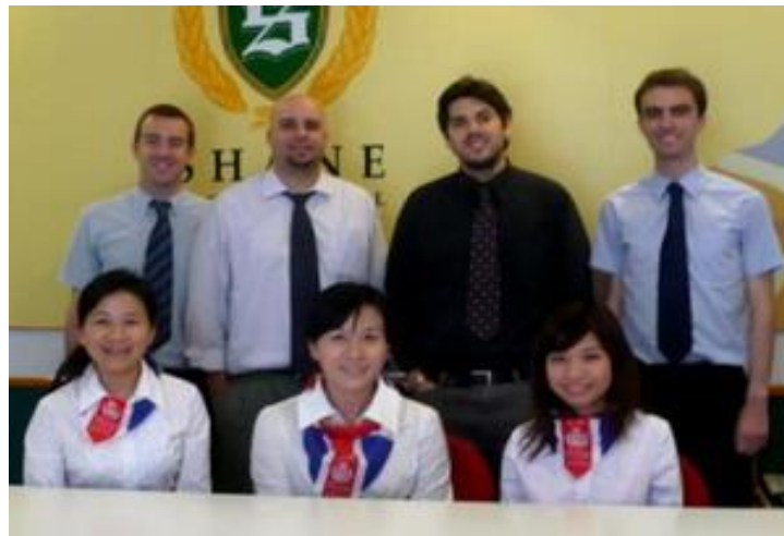
圖 5.松竹分校的外籍教師多來自於澳洲，且全數都是男性