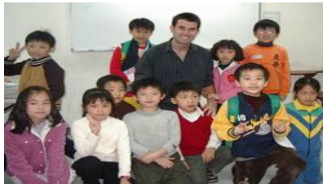
圖 3.班上小朋友的性別主要以男生占多數

每班上課學生是由男生和女生組成。班級人數不超過 10 人，大部份班級的學生以男生居多，女生則只有一、二個，男女比例差很多，極少數的班級是女生多於男生。