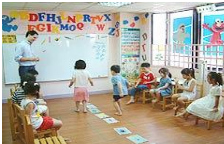
圖 6.小朋友在快樂的環境下學習

現補習班也規劃讓小朋友在室外也可以學習英語，而且可以學不一樣的東西。針對學習地點的不同，本組提出對於學習成效的看法。