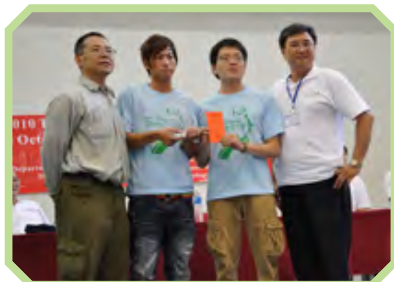
▲2010年亞太E-car競賽第二名