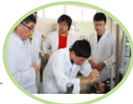
▲高效能半製備級液相層析儀