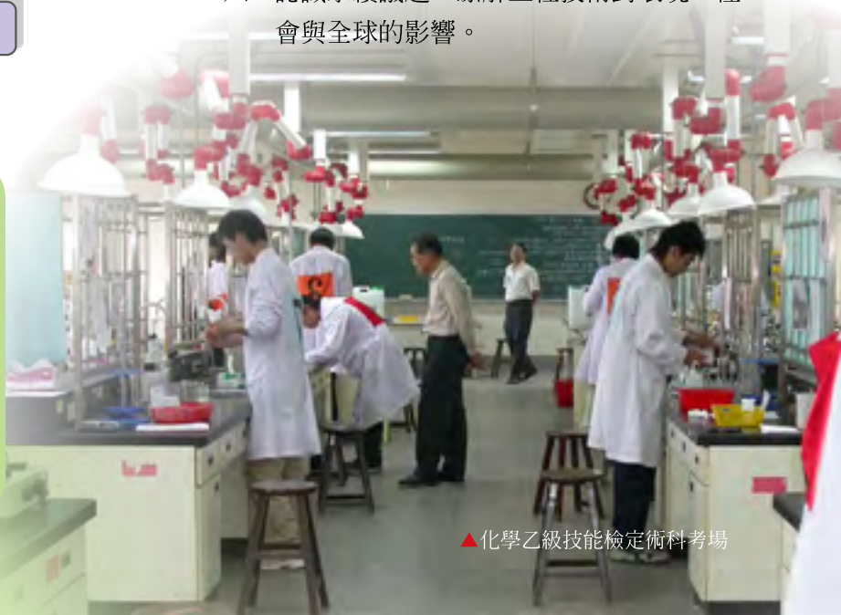
▲化學乙級技能檢定術科考場