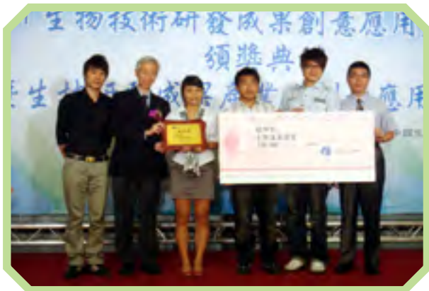
▲經濟部2009年生物技術研發成果創意應用競賽 本系一綠油油隊 榮獲大專全組銀牌獎

Department of Energy and Materials Technology