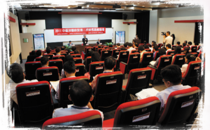
【高峰論壇開會情形】

2011中區技職校院第二次校長高峰論壇於10月5日在本校樹德樓六樓A0607會議室舉行。這項會議係由國立雲林科技大學中區技職校院教學資源中心主辦，本校與環球科技大學承辦。參加會議人員有中區技職校院22所夥伴學校校長、高階主管1人、教學資源中心主任、及主軸三計畫10所學校主持人。 校長高峰論壇開幕式由雲林科技大學楊永斌校長、本校鍾瑞國校長、環球科技大學許舒翔校長共同主持，開幕後隨即進行一天的議程：一、雲林科技大學楊永斌校長專題演講：EAC與TAC認證之理念；二、中華工程教育學會認證委員會劉曼君副執行長主講：TAC的認證指標與程序；三、南開科技大學工管系楊烈岱主任主講：EAC認證經驗分享(一)；四、建國科技大學工程學院曾憲中院長主講：EAC認證經驗分享(二)；五、圓桌論壇討論議題：高等技職校院優質化辦學政策與變革經驗。引言人為雲林科技大學楊永斌校長：雲林科技大學辦學政策—產學合作與教學品保機制之關聯；朝陽科技大學鍾任琴校長：朝陽科技大學—推動教學品保制度經驗分享。經由二位校長引言，與會人員熱烈討論後，結束一天的議程。