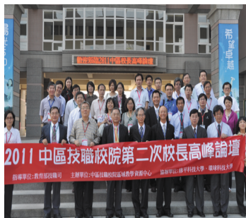
中區技職院校校長高峰論壇 (相關新聞見第二版)