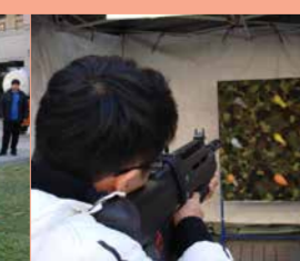
同學以BB彈射擊印有毒品種類圖案的汽球。