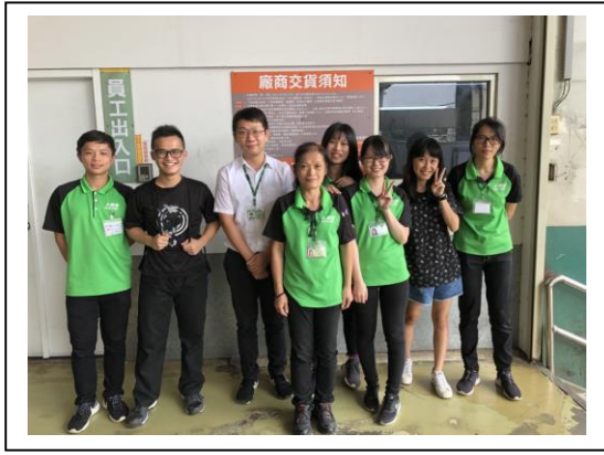
圖 3-4 工作夥伴