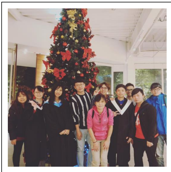
圖 3-2 聚餐照片