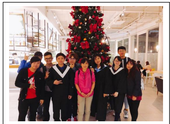
圖 3-3 聚餐照片